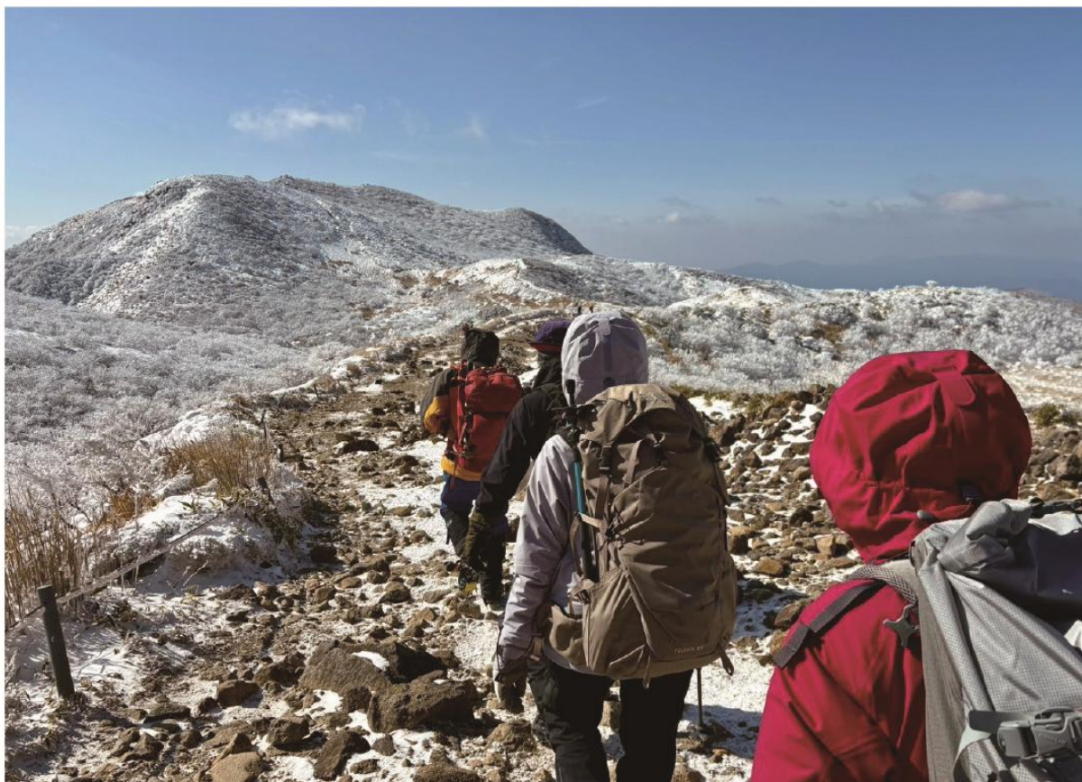
2026. 1. 24-25 新春雪山訓練 九重山系