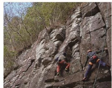
1/25 岩トレ 矢岳