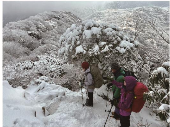
1/24-25 新春雪山訓練 九重山系