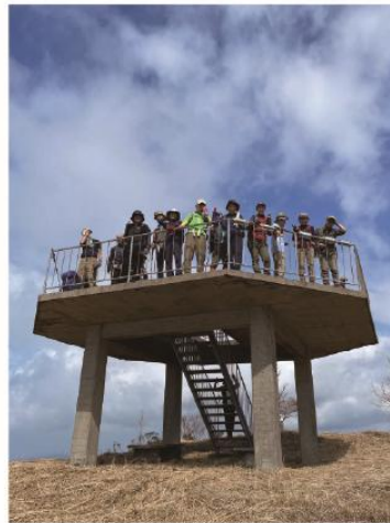
2/15 西彼半島 大野岳