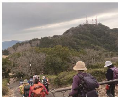
2/14 小江原から 稲佐山