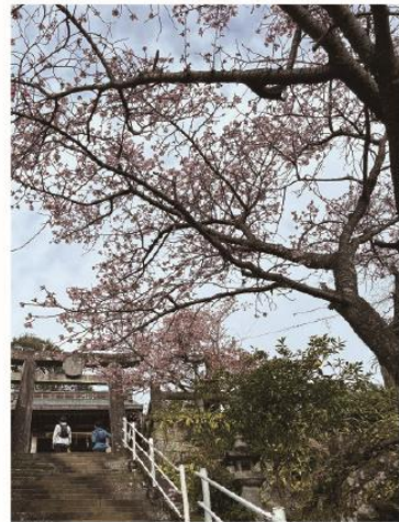
1/8 11社巡り 西山神社 (1/31撮影)