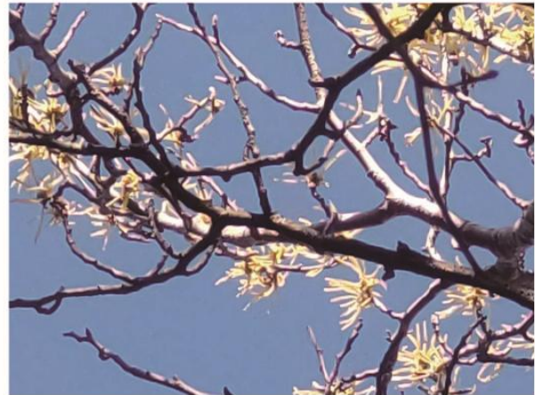
3/15 春一番マンサク咲く 多良山系