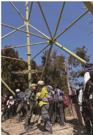
3/14 東部低山縦走 矢上普賢岳