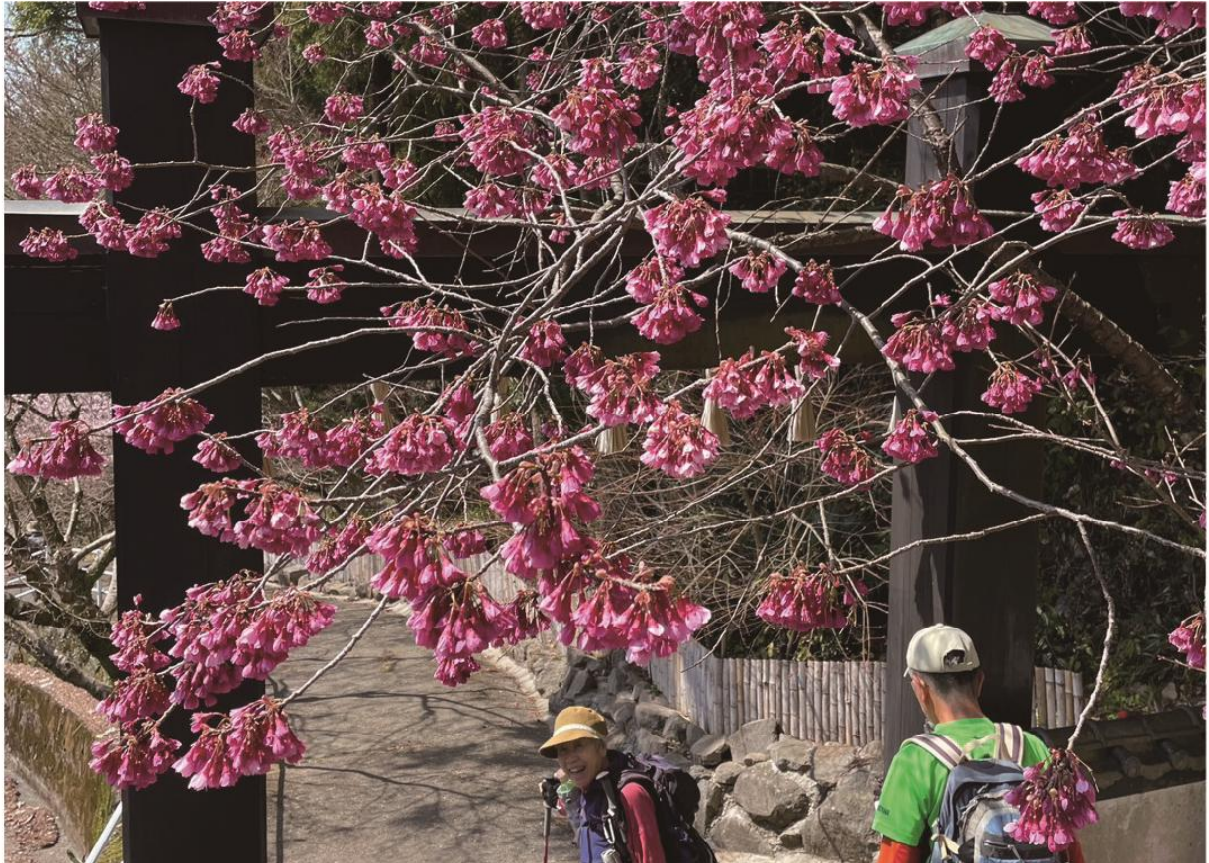
2026. 3. 12 登山教室&啓翁桜観賞 (七面山の緋寒桜)