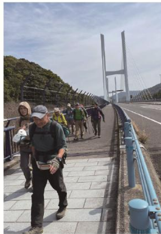
3/8 長崎港西岸尾根 女神大橋