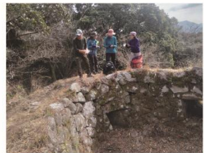
2/26 ちょいロング 東長崎〜烽火山