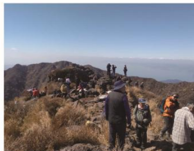
2/21 雲仙花ぼうろ 霧氷観賞登山