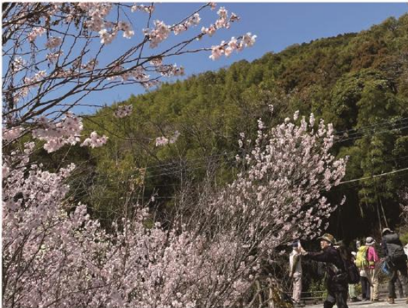
3/12 登山教室&啓翁桜観賞 七面山