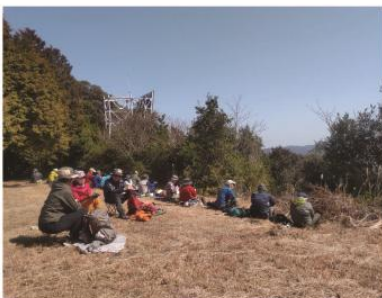
2/23 長崎西北部歩き 鳴鼓三山