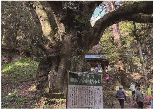
3/20 早春の福寿草 雪割一華 大ケヤキ観賞 四辻峠