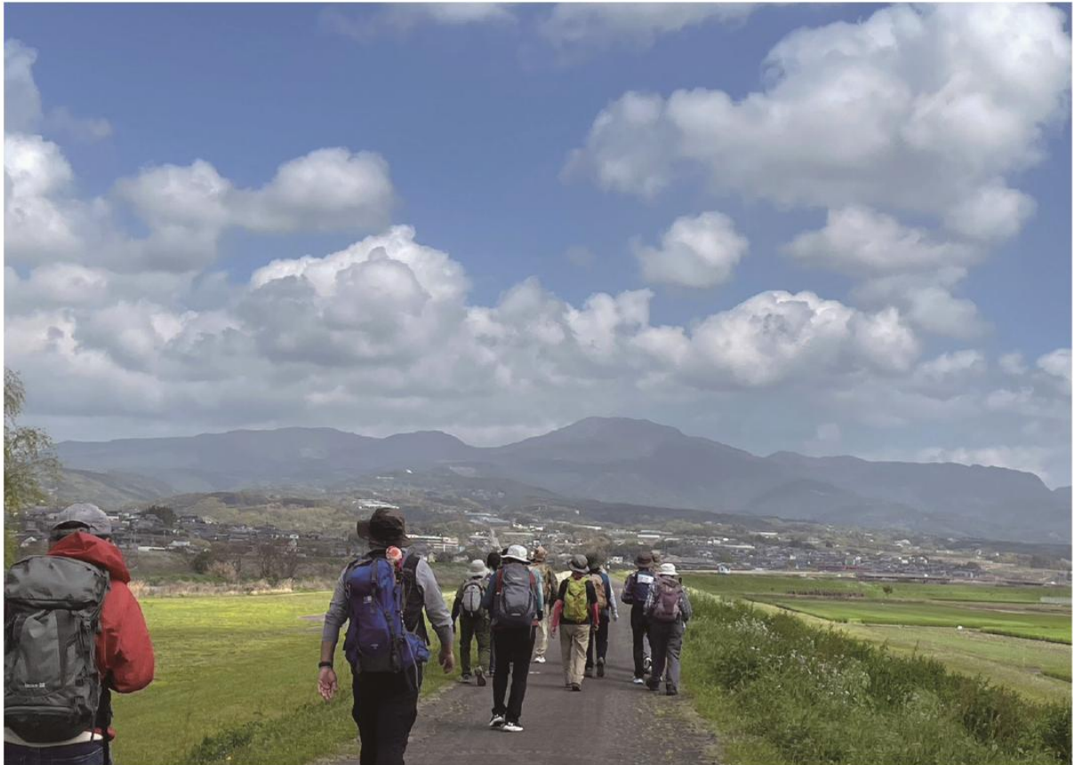
2026. 4. 5 のんびり散歩 諫早の桜観賞