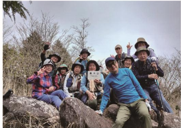
4/12 春の花観賞登山 倉木山