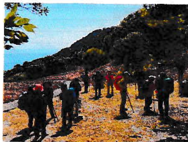
3/9 橘湾を一望 小八郎岳