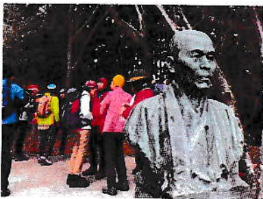
2/23 長崎港を一望 烽火山