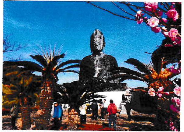
2/27 第10回島巡り 生月島 (平戸市)