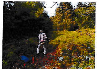
3/1 クリーンハイク鳥帽子岩周辺