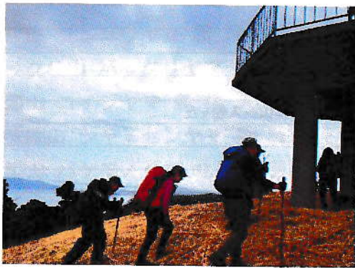
3/8 神の国のニュートレイル 大野岳