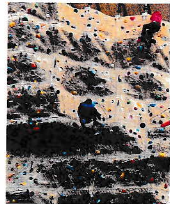
3/19 岩トレ 県立体育館