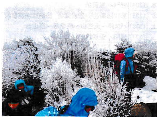
2/24 雲仙花ボウロ 霧氷登山