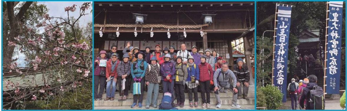
1/8 長崎市内 11社巡り