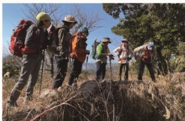
1/14 ゆっくり登ろう 烽火山