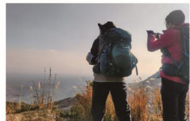
12/21 一年の締め 八郎山系縦走