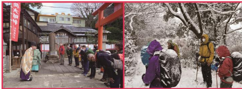
1/11 新年恒例 七高山巡り