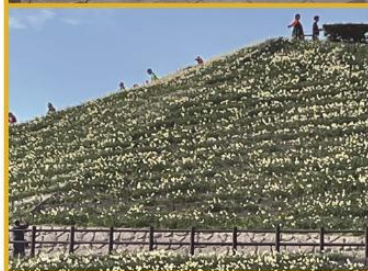
1/18 第28回 野母崎水仙ウォーク