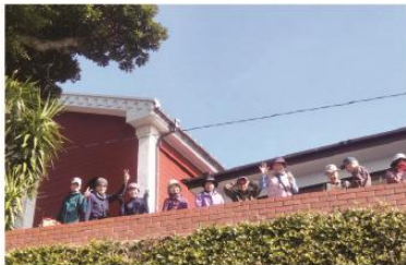
1/17 のんびり山行 城山