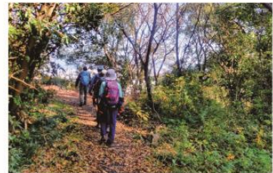
12/18 月に一度は 岩屋山